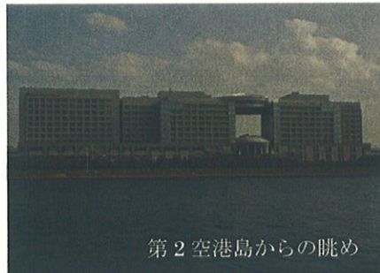
第2空港島からの眺め