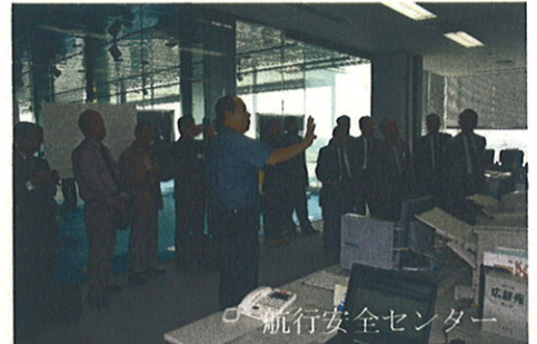
航行安全センター