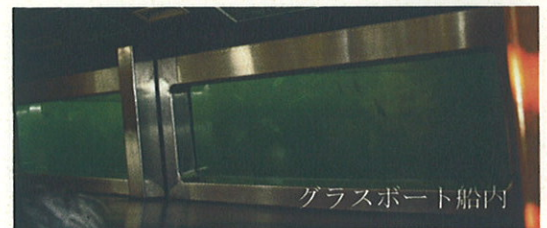
グラスポート船内