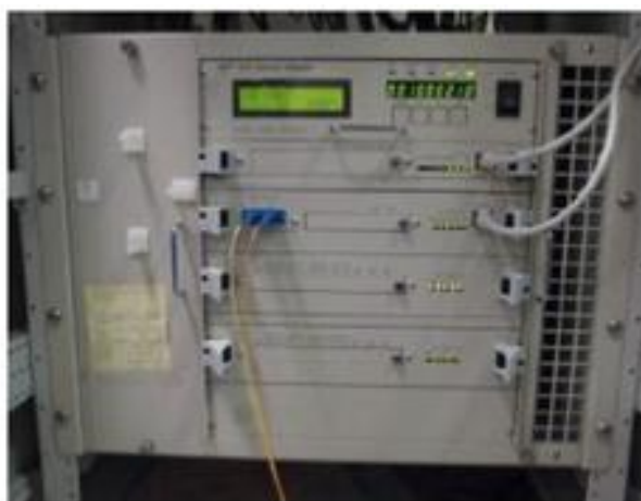
図 2 OCTAVIA