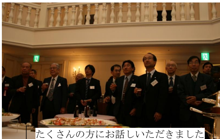
たくさんの方にお話しいただきました