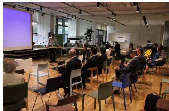
ワンダーラボのコンセプト、活動説明