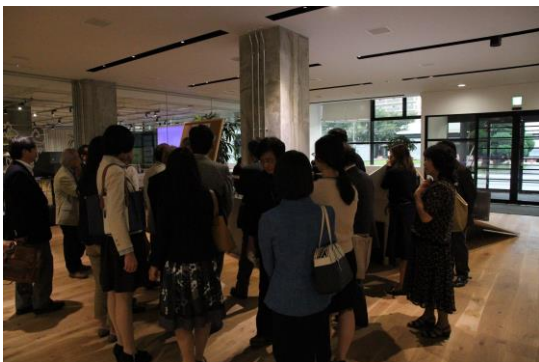
ワンダーラボでの創作物見学