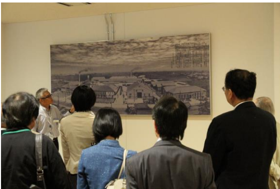
門真での歴史説明

今回の会場でもあるワンダーラボ大阪の概要と具体的展示・活動内容を見学した。歴史的背景や現在 Panasonic で行なわれているワンダーラボを活用したイベント、そこから発生したアウトプットなどをご紹介していただきました。