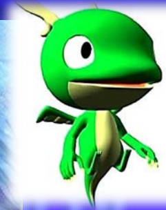
目で聴くテレビ キャラクター eye龍(あい・ろん)