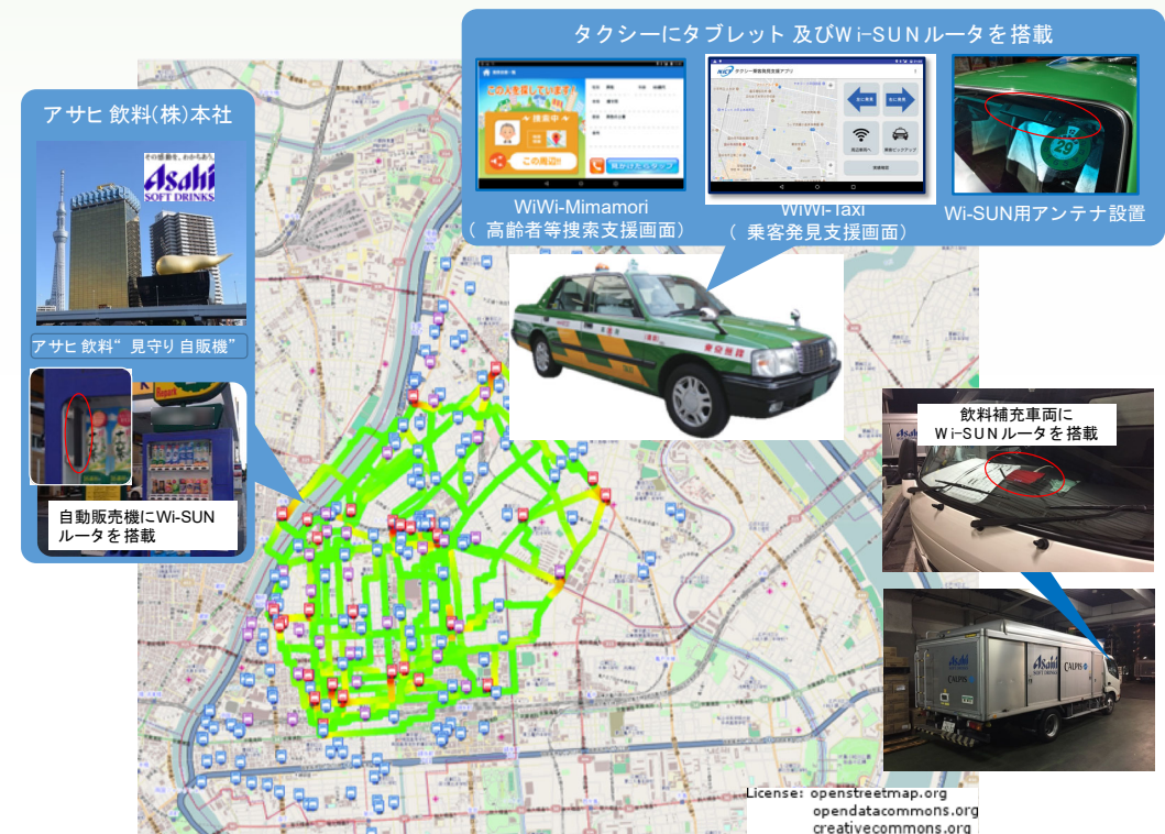
飲料自動販売機・タクシー等へのWi-SUNデバイス搭載の様子と、これらデバイス間のつながりによる地域ネットワーク構築の様子