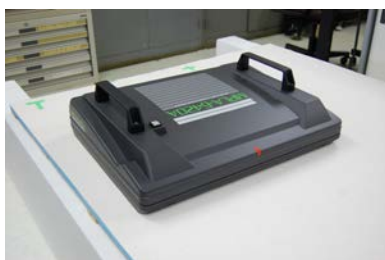
図1 試作機外観 (GPR 本体)

図1に完成した試作機の外観を、図2に試作機の出力例（石膏ボード裏面8cmの距離に置いた木材 材質楡 幅；9cm、長さ；32cmの画像）を示す。図2から試作機を用いて石膏ボードを透過して木材を3次元映像化できることを確認した。