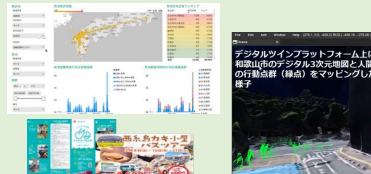
大規模位置データ連携による観光施策立案評価システム (九大、(株)アログウォッチャー、九工大)