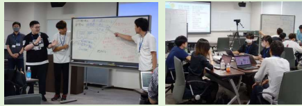
アイデアソン+仙台2023の様子