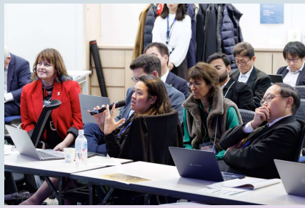
Global Fusion 各国が持つ強みの相乗効果を見極め、グローバルな社会的価値を生み出しながら世界中のパートナーとの協創を強化