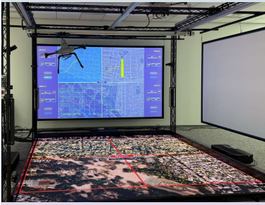
Challenge Studio アジャイルな実証により、複雑に変化する社会課題に追従した研究開発を加速

は、2030年以降の未来を切り拓くため、情報通信を中心とした先端技術と多様なアイデアが横断的に交わり、新たなイノベーションを創出する拠点です。ここでは、世界中のだれもが公平に参加でき、信頼のもとで協創活動を行える環境を提供することで、 産業と学術 の多様な分野から 持ち寄られた英知 を相互に融合し、 新たな価値創出 への道筋を迅速に見極めて、社会実装への橋渡しを加速します。そのため、取り組むべき3つの柱として、 アジャイル実証、協創コミュニティ、グローバル連携 に注力していきます。