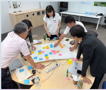
Synergy Ecosystem 未来を共に構想し、共通の目標に向けて活動を行う異業種や若手や地域との連携を発掘