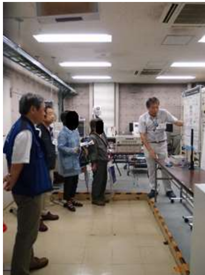
職員による研究内容の説明