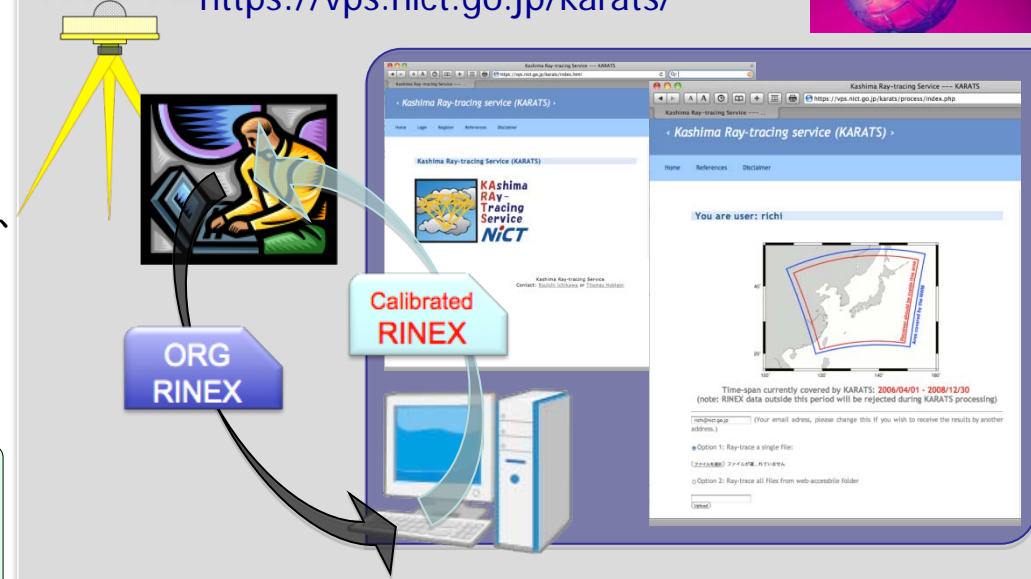
図3 KARATSの動作イメージ